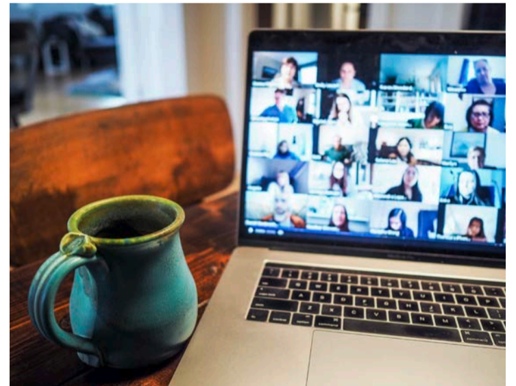
Ein Moderator bestimmt bei der Videokonferenz, wer das Wort hat.