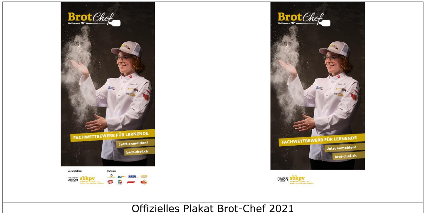
Offizielles Plakat Brot-Chef 2021