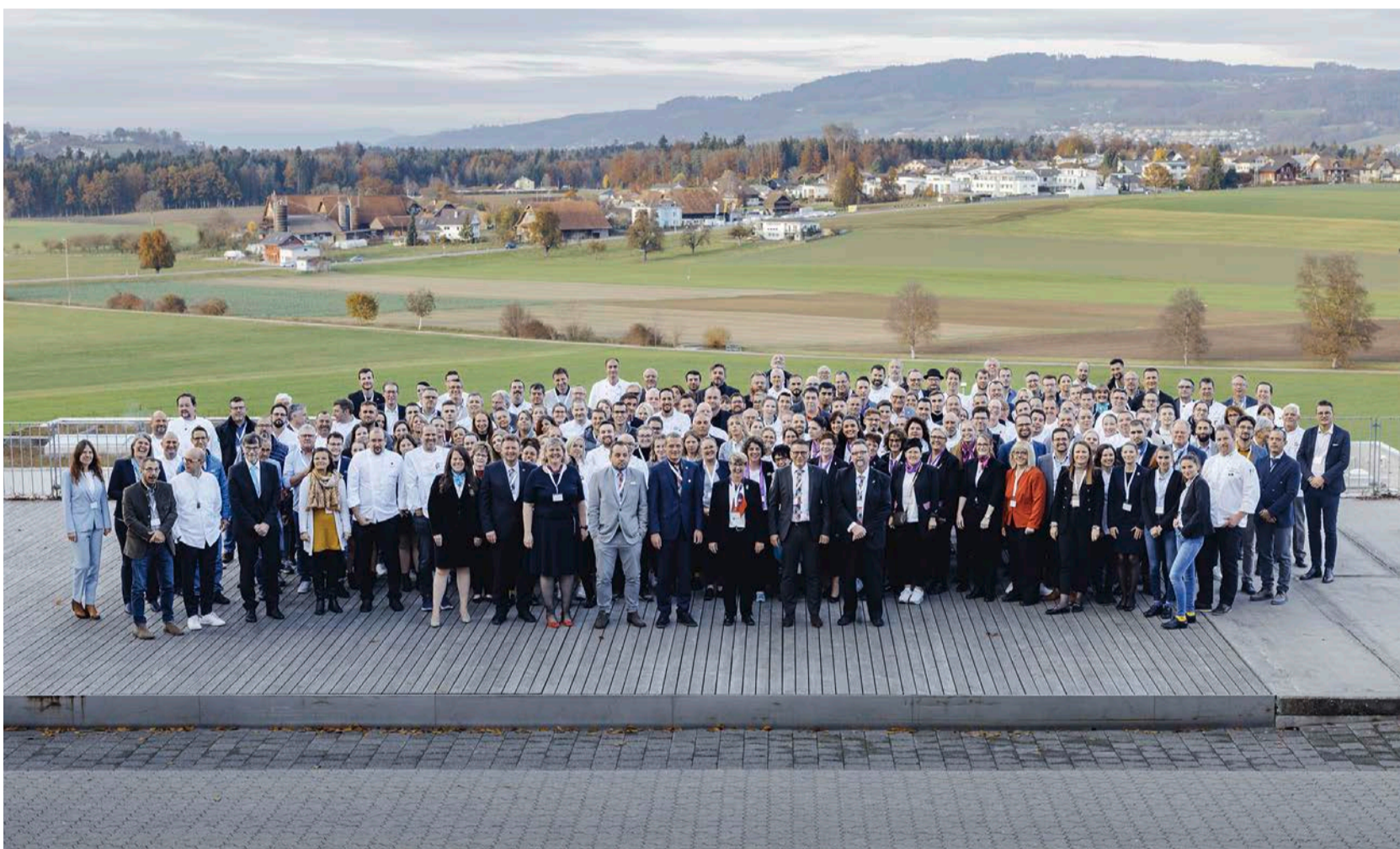
Delegiertenversammlung: Engagierte Mitglieder der Hotel & Gastro Union bestimmen die berufliche Zukunft der gastgewerblichen Mitarbeitenden.