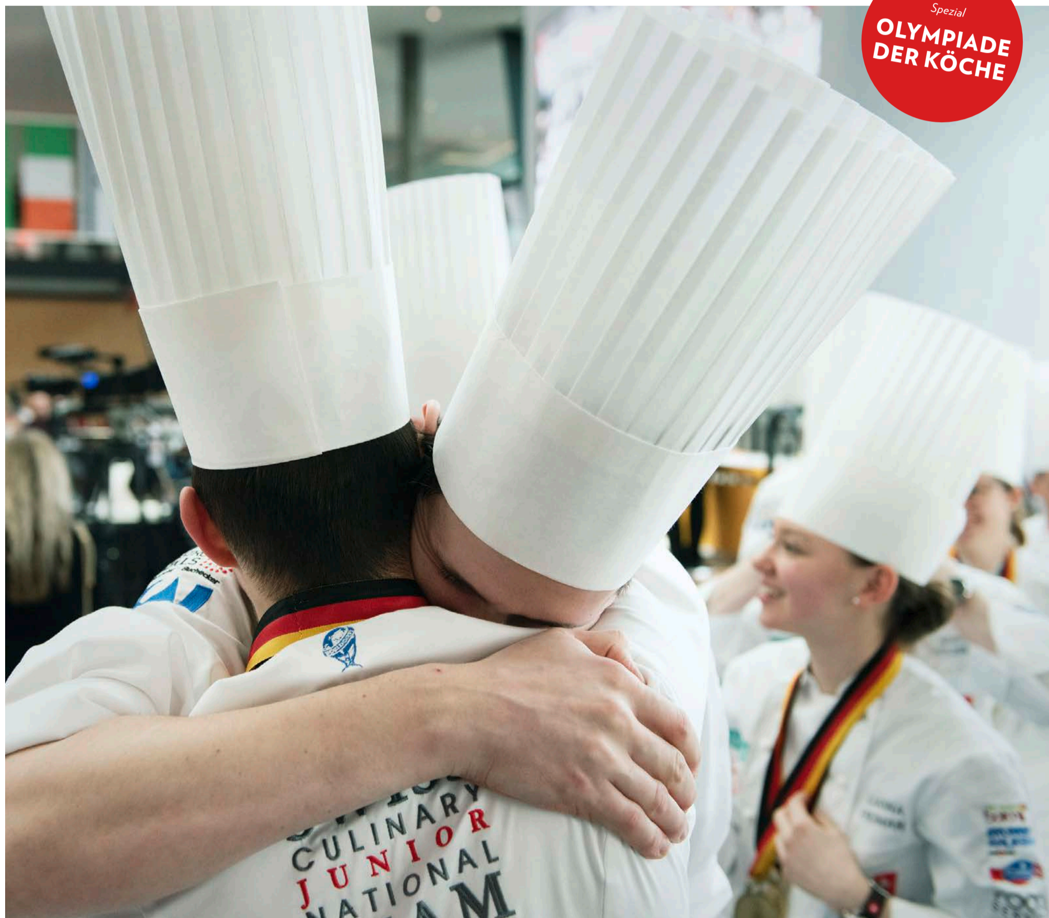
Die Mitglieder der Junioren-Kochnationalmannschaft fallen sich in die Arme: Ihre gute Leistung wurde mit zwei Goldmedaillen und einem dritten Platz in der Gesamtwertung belohnt.

Für die Schweizer Teams ist am Mittwoch eine erfolgreiche Olympiade der Köche zu Ende gegangen. Trotz ein paar Enttäuschungen konnte die Schweiz mit den Top-Teams der Welt mithalten und durfte sogar einen Olympiasieger feiern.