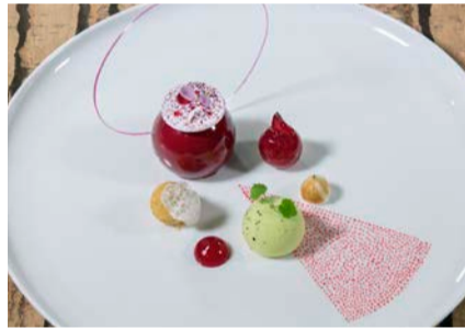
Der Luzerner Tisch überzeugte die Jury in allen Kategorien. Zum Thema «From the valley up to the mountains» zeigte das Team unter anderem eine Schauplatte mit gebeiztem Schweizer Lachs oder Tessiner Rhabarber und Ziegenfrischkäse.