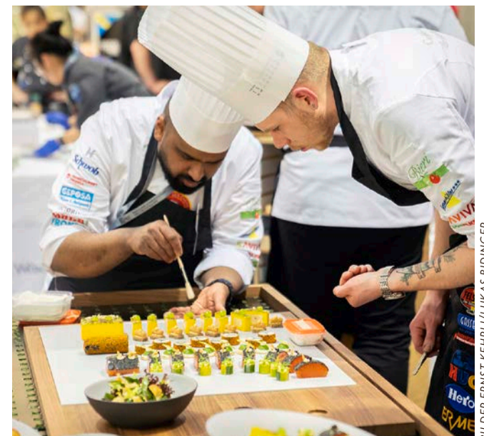
Impressionen vom Berner Tisch, der sich ganz regionalen Spezialitäten widmete. So wurde unter anderem ein modern interpretierter Zwiebelkuchen (unten links) präsentiert. Besonderes Lob erhielt die aufwändige Schauplatte (unten rechts).