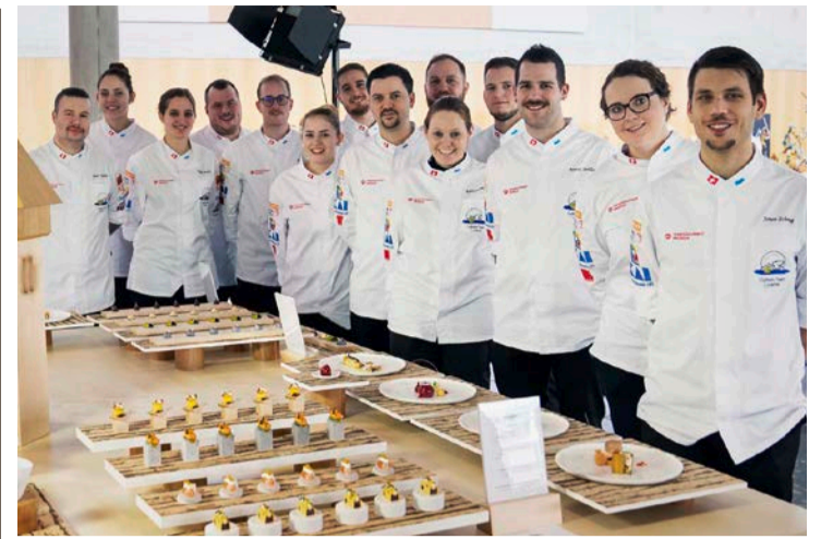
Die erfolgreichen Luzerner am Ausstellungstisch, der dem Cercle des Chefs de Cuisine Lucerne den Sieg einbrachte.