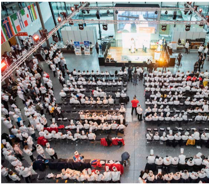
Vollbesetztes Atrium während der Siegerehrung am Mittwoch. LUKAS BIDINGER