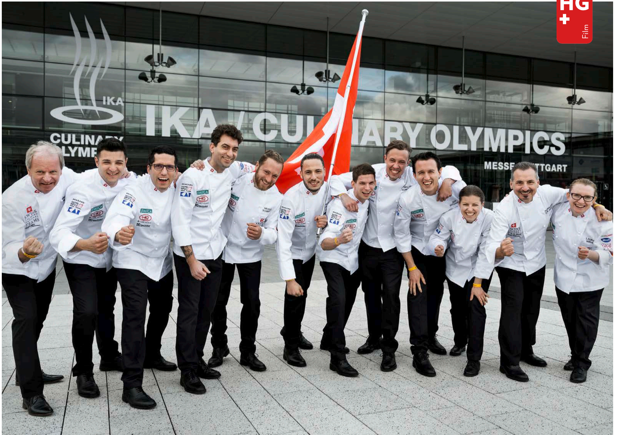
Das Team der Schweizer Kochnationalmannschaft mit Coach, Manager und Helfern vor den Hallen der Intergastra-Messe, in denen die Olympiade der Köche erstmals ausgetragen wurde. Ein Video gibt es auf unser HG+-App.