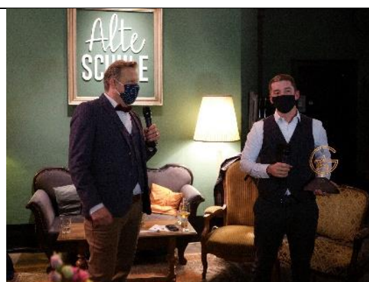
Die Pokalübergabe fand gemäss den aktuellen Schutzmassnahmen statt.