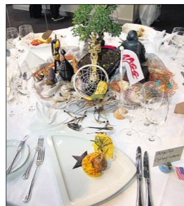
Beim Teamwettbewerb Küche-Restauration gewinnt das Konzept «In 80 Tagen um die Welt» Silber.