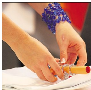
Die Kandidaten achten auf jede Kleinigkeit. So wird mit viel Liebe zum Detail gearbeitet.