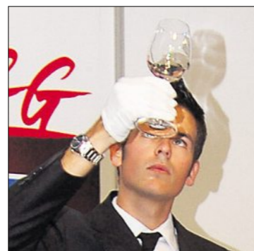
Handschuhe, heisses Wasser und ein sauberes Tuch zum Polieren. So wird jedes Glas blitzblank sauber.