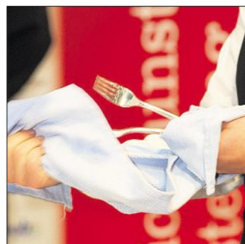
Wer nichts dem Zufall überlassen will, poliert das Besteck vor dem Aufdecken nach.