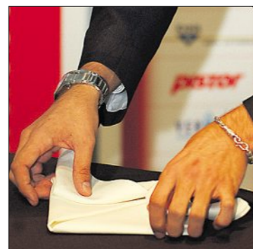
An der Servicekunstausstellung sind diverse Variationen von Serviettenfalkunst zu sehen.